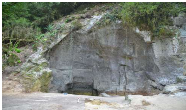
Vue générale de la carrière de Pied Griffé

“Pied Griffé”, une carrière de sarcophages du haut Moyen Âge dans la vallée de l'Anglin