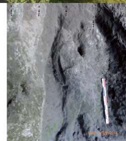
Les carrières du Cliersou (G. Martin et S. Gaime, 2018)

Inscription aux conférences du matin obligatoire (nb de places limité) : daniel.morleghem@gmail.com