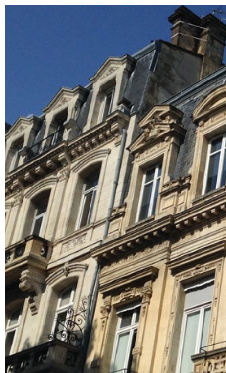
Bordeaux, Mathieu GIGOT

Pour assumer cette responsabilité, le Code de l'urbanisme offre de nombreux outils.