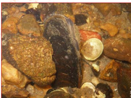
Individus de Grande Mulette en milieu naturel, Creuse

Le projet LIFE+ Conservation de la Grande Mulette en Europe est un projet œuvrant à la préservation et la conservation des populations de Grandes Mulettes, en menant, entre autres, de la reproduction artificielle à visée de réintroduction.