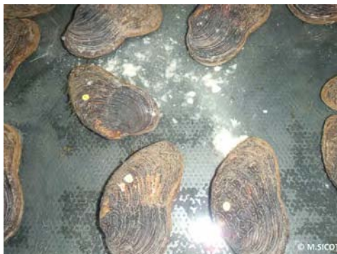
Émission des glochidies