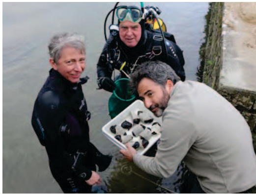
Prélèvement en milieu naturel, mars 2017

Ces laboratoires abritent les bassins et aquariums pour la maintenance des moules et poissons ainsi que l'ensemble des dispositifs de contrôle de la qualité de l'eau, de l'air, de la température, qui sont couplés à un système d'alarme.