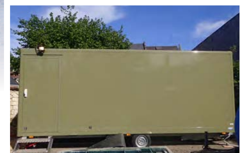
Laboratoire mobile, Chinon

Ils ont été conçus en intégrant les différentes réflexions des membres de l'équipe du Life afin d'être tout à fait adaptés aux recherches scientifiques menées dans le cadre du projet.