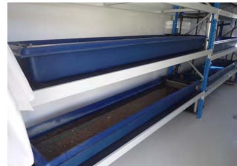
Auges d'élevage dans le laboratoire mobile, Chinon

Chaque année, des adultes de Grandes mulettes sont prélevés dans le milieu naturel en période de reproduction (mars-avril). Elles sont marquées afin de les suivre les années suivantes et examinées pour vérifier si elles sont prêtes à émettre les larves (glochidies).