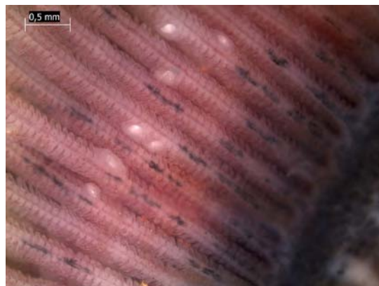
Glochidies enkystées sur des branchies d'esturgeon