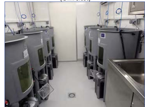
Bassins du laboratoire de reproduction artificielle, Chinon

Une fois les larves expulsées, les mulettes adultes prélevées sont remises dans leur milieu naturel. Au bout d'un mois environ, les larves devenues juvéniles se décrochent des branchies des poissons et sont collectées, comptabilisées puis mises dans des auges avec du sédiment pour les élever. Les actions de reproduction menées en 2016 ont permis la collecte et mise en auge de 28 000 juvéniles de Grande mulette .