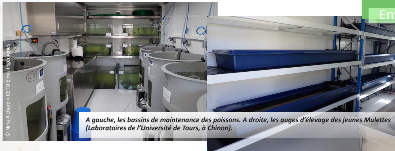
A gauche, les bassins de maintenance des poissons. A droite, les auges d'élevage des jeunes Mulettes (Laboratoires de l'Université de Tours, à Chinon).

Diverses études sont menées afin de déterminer les distributions historique et actuelle de la Grande Mulette en France. Ainsi à la suite d'une étude bibliographique menée antérieurement au programme Life, des prospections ont été menées dans les muséums régionaux français afin d'examiner les collections de coquilles de Mulette et d'affiner la distribution historique de l'espèce. Les inventaires dans plusieurs cours d'eau français et le suivi des populations vivantes sont poursuivis. Le projet Life a ainsi permis de découvrir une nouvelle population vivante dans un affluent de l'Adour.