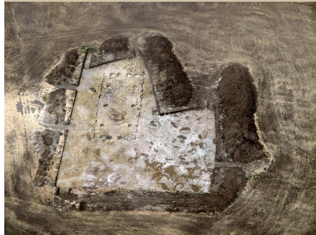
Vue aérienne du bâtiment D de la résidence aristocratique gauloise de Batilly-en-Gâtinais, Loiret (cliché D. Chesnoy)

à l'Université François-Rabelais de Tours, UFR de Droit, Économie et Sciences sociales, amphi F, 50 rue Portalis, Tours (Indre-et-Loire)