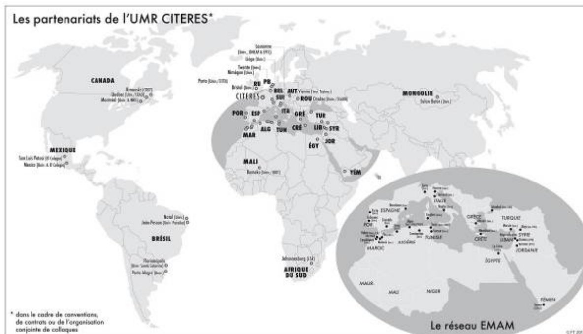
Figure 2 : Partenariats de l'UMR CITERES

La mise en place de collaborations à travers des séminaires des colloques ou des échanges scientifiques.