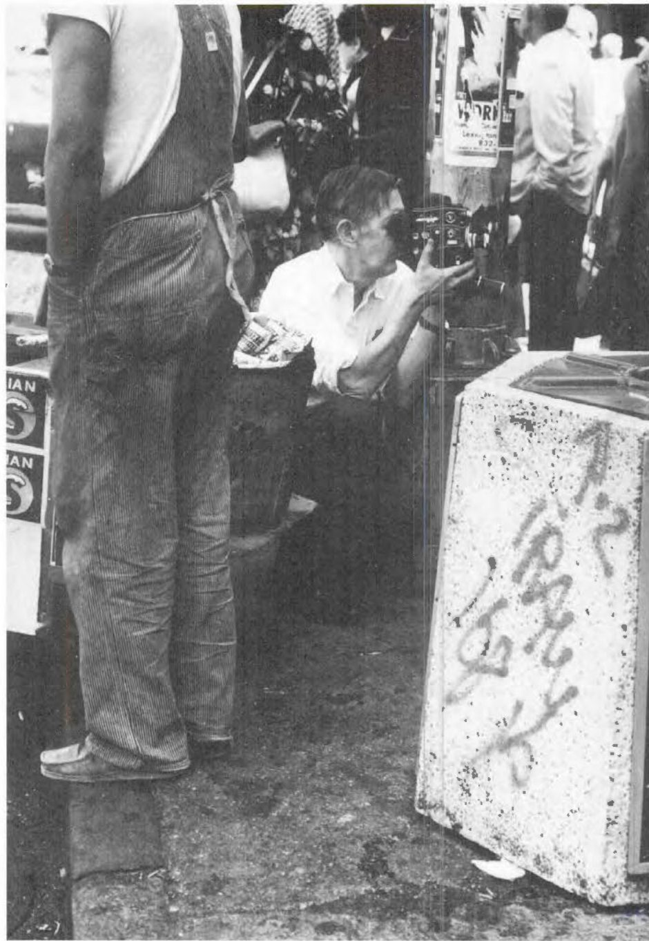
William H. Whyte, New York City, années 1980