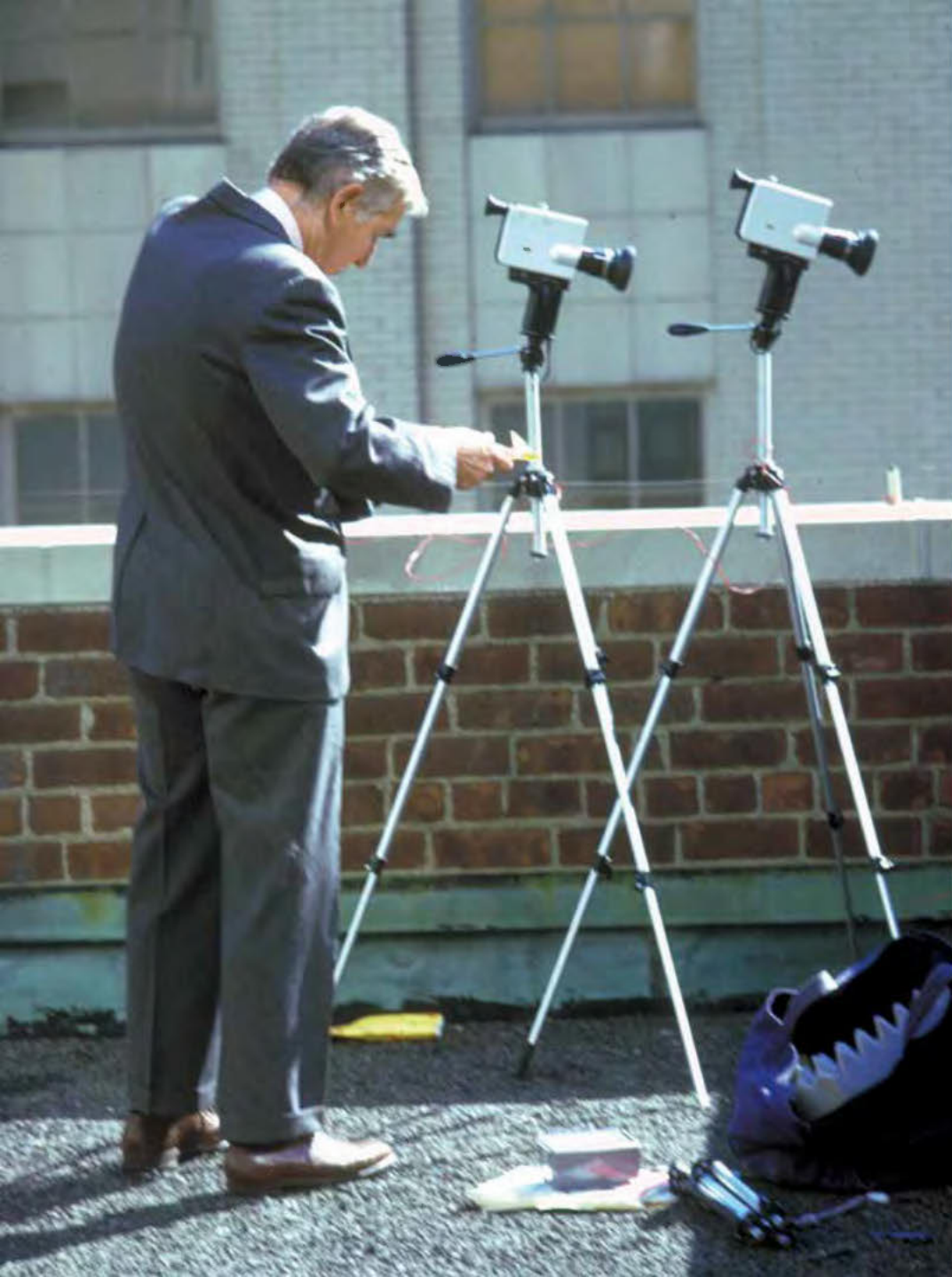
William H. Whyte, New York City, années 1980