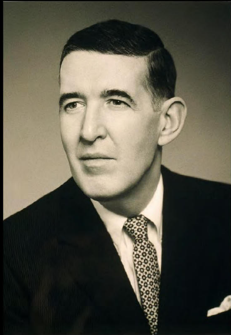
William H. Whyte (1917-1999)