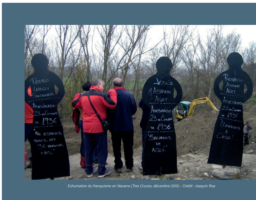
Exhumation du franquisme en Navarre (Tres Cruces, décembre 2015)